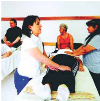
Lors de la formation au premier niveau de Healing Force, la pratique peut également avoir lieu en groupe.

Si sans effort vous observez ce processus de transformation constante avec une attitude détachée, sans l'évaluer, vous pourrez l'adresser progressivement à sa racine et lui permettre de se rééquilibrer de lui-même de la manière la plus directe et efficace possible. La véritable capacité de régulation naturelle de l'organisme (l'homéostasie) semble se trouver dans cet état de non-changement dynamique de la conscience au milieu du changement qu'elle