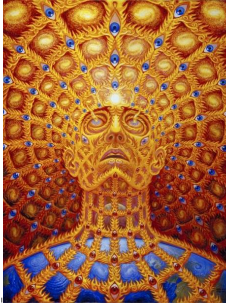
Ilustración por Alex Grey©